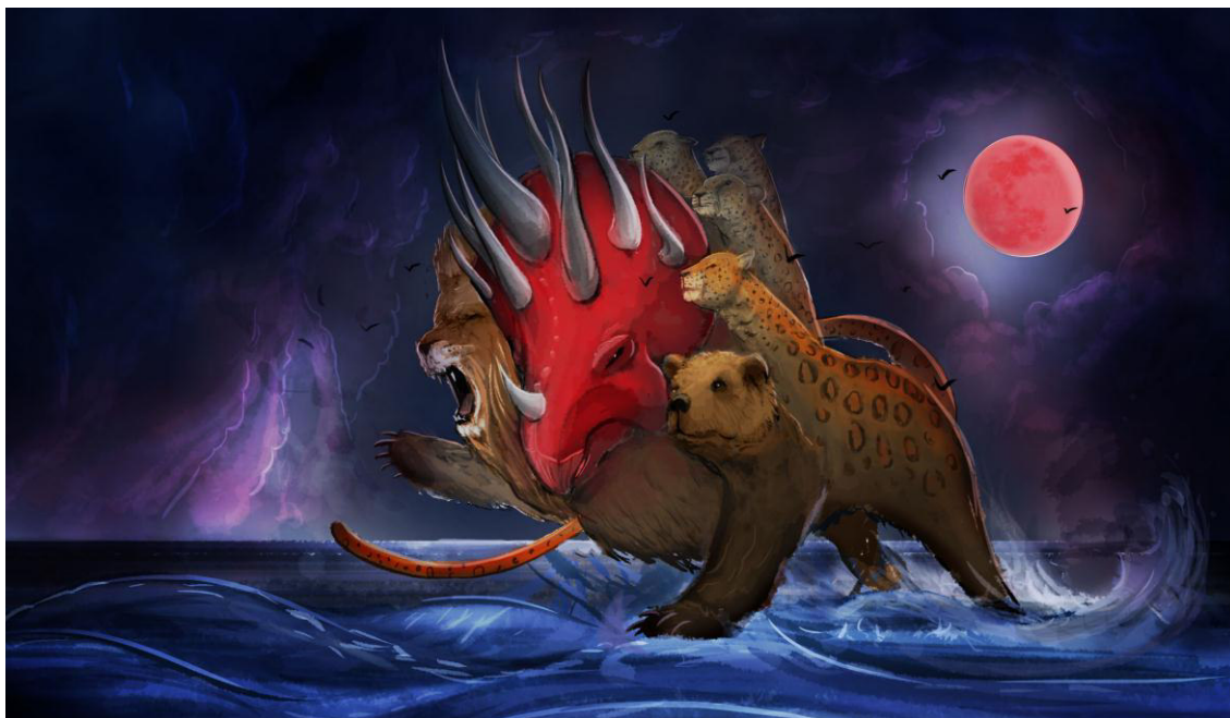
La bestia de Apocalipsis 13 que sale del mar.

Al sumar tenemos un total de siete cabezas; así también obtenemos diez cuernos. La bestia del Apocalipsis tiene siete cabezas y diez cuernos que poseen elementos anatómicos de un oso (Medo-Persa), un león (Babilonia) y un leopardo (Grecia-Turquía) por lo que es la fusión de los cuatro animales descritos en el capítulo 7 de Daniel. Nos encontramos con un razonamiento similar con la estatua del rey Nabucodonosor: Vendrá a la vida a través de un sólo reino ocupando al mismo tiempo todos los reinos que forman parte de ella.