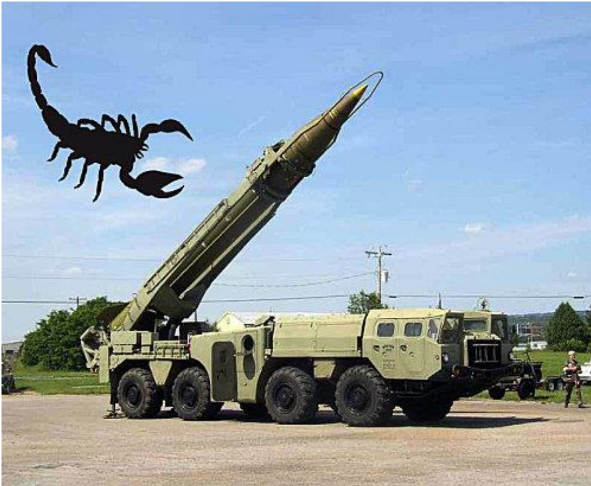
Foto: lanzador de misiles scud.

...Y los otros hombres que no fueron muertos con estas plagas, NI AUN SE ARREPINTIERON de las obras de sus manos, ni dejaron de adorar a los demonios, y a las imágenes de oro, de plata, de bronce, de piedra y de madera, las cuales no pueden ver, ni oír, ni andar; Y NO SE ARREPINTIERON de sus homicidios, ni de sus hechicerías, ni de su inmoralidad sexual, ni de sus hurtos.